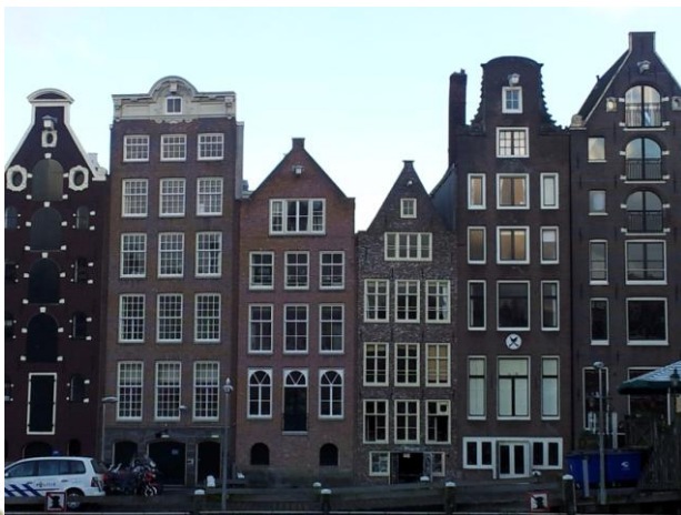
Amsterdam maisons sur le dam

Fabrice LAMY Gouverneur 2012-2013 District 1710 Lyon Région